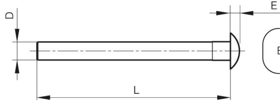
BT Broche à Tête Headed pin Stift mit Kopf